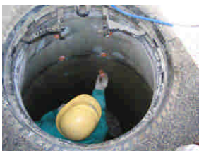
止水スリーブ埋込