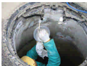
ツインロック含浸挿入