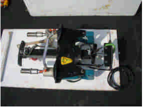
ツインドリル本体

3月17日(火) 盛岡市下水道部及び数社、計23名様を迎え、デモンストレーションが実施されました。