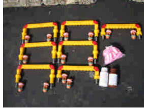
RS-30S 止水スリーブ 樹脂系接着剤ツインロック 化粧キャップ (6セット使用)