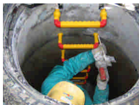
ステップ取付、化粧キャップ